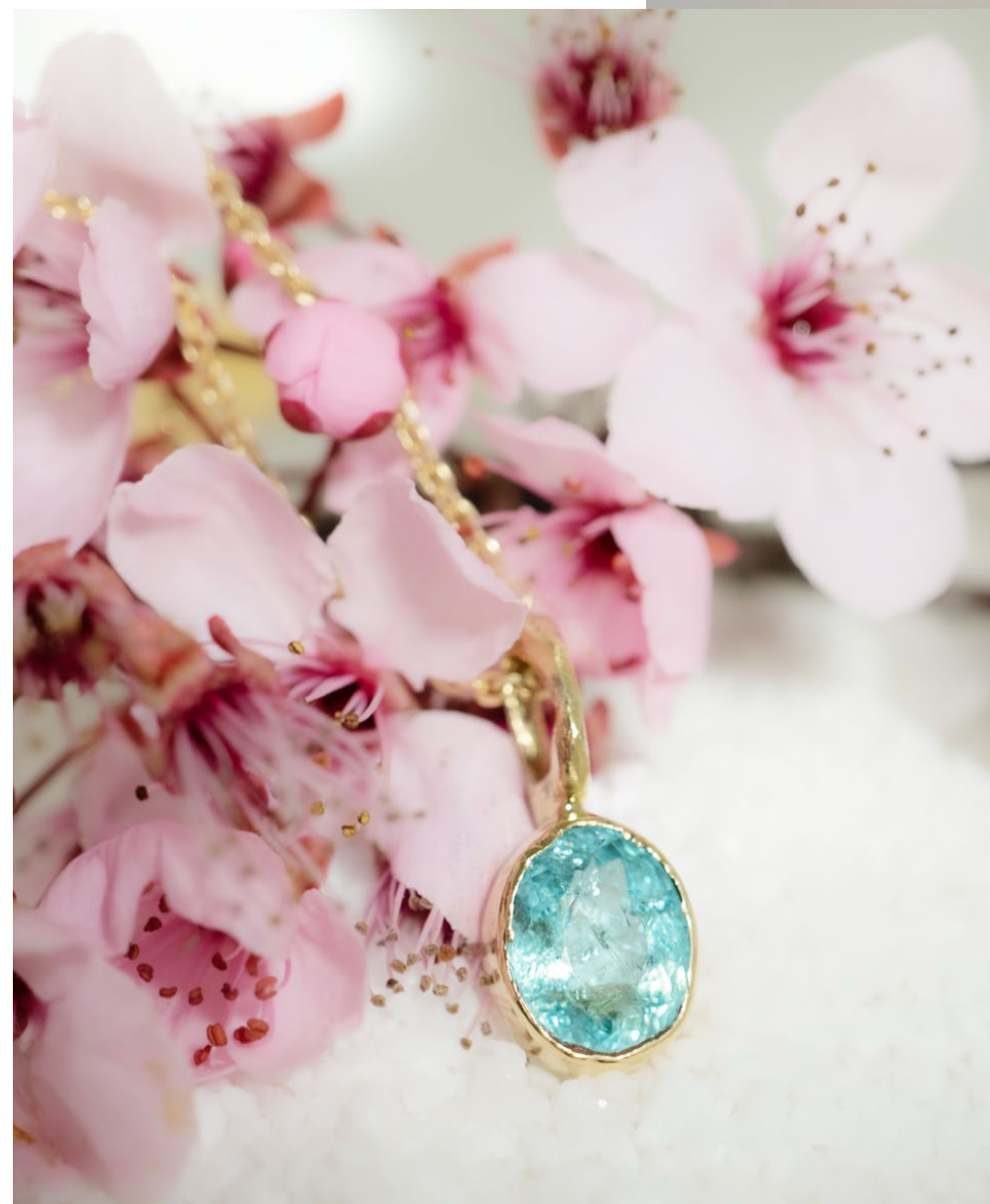
Anhänger in Rosegold mit Paraiba-Turmalin

Mutter und Tochter ist es wichtig, alles von Grund auf selbst herzustellen. Deshalb kaufen sie keine Rohlinge, sondern giessen und schmieden eigenhändig. Anstelle von Laser und Maschinen findet man in der Silberschmiede viel Handwerkzeug. Mit Feuer, Hammer und Amboss entstehen so spannende und feingliedrige Eigenkreationen. Davon kann man sich vor Ort selbst überzeugen – im edlen Ladengeschäft befindet sich auch gleich das Atelier.