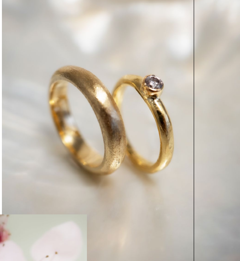
Partnerringe in Gelbgold mit Diamant